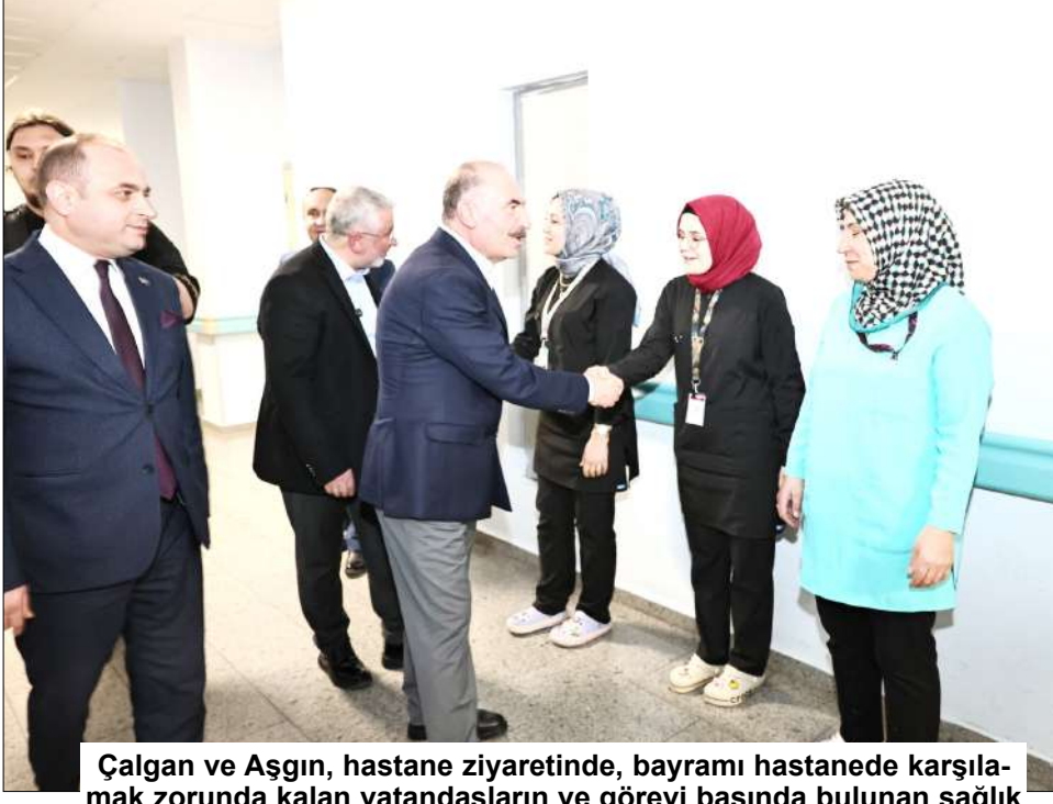
alġan ve Ařġın, hastane ziyaretinde, bayramı hastanede karřılamak zorunda kalan vatandařların ve grevi bařında bulunan sađlık personelinin bayramlarını tebrik etti.