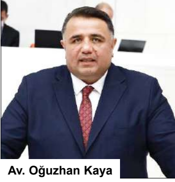
Av. Oğuzhan Kaya