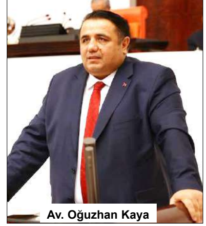
Av. Oğuzhan Kaya