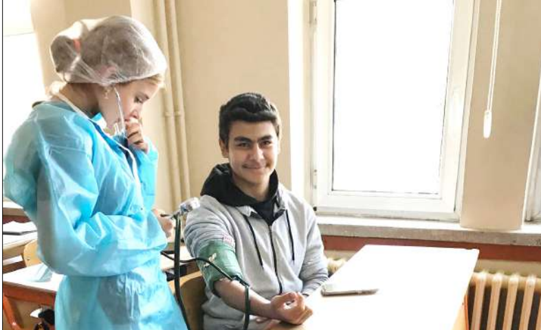
Türkiye Yüzyılı Maarif Modeli kapsamında "Destekleme ve Yetiştirme Kursları Beceri Geliştirme Programı" çerçevesinde öğrencilerine iş sağlığı ve güvenliği eğitimi veriyor.