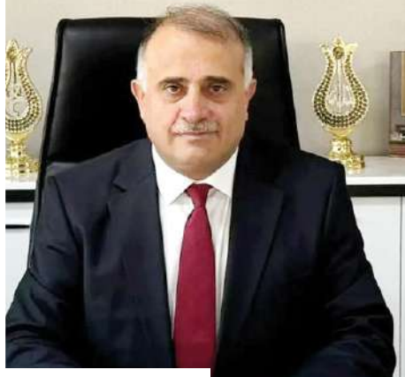
Av. Yakup Alar