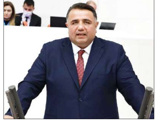
Yardımcılığı görevine getirildi.

Cumhurbaşkanı ve AK Parti Genel Başkanı Recep Tayyip Erdoğan, AK Parti Milletvekili Av. Oğuzhan Kaya'yı, Bursa Milletvekili Hakan Çavuşoğlu'nu, İzmir Milletvekili Mahmut Atilla Kaya, Manisa Milletvekili Mehmet Ali Özkan'ı, Isparta Milletvekili Recep Özel'i ve Kütahya eski Milletvekili İshak Gazel'i Genel Merkez Seçim İşleri Başkan