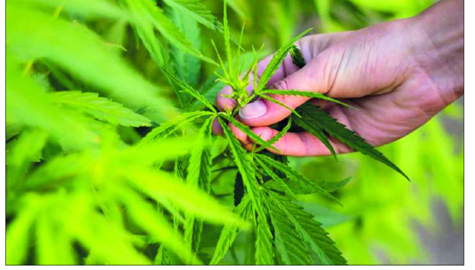
gelerle birlikte kenevir üretim izni almak için en yakın İlçe Tarım ve Orman Müdürlüklerine müracaat etmeleri gerektiğini bildirdi. (Çağrı Uzun)

Tarım ve Orman İl Müdürlüğü, Çorum'da kenevir tarımı yapmak isteyen ancak çeşitli sebeplerle üretim parse- linde farklı ürün beyan eden ya da yeni parsel sahibi olan, kiralayan üreticilerin, yönetmelik ekinde bulunan bel-