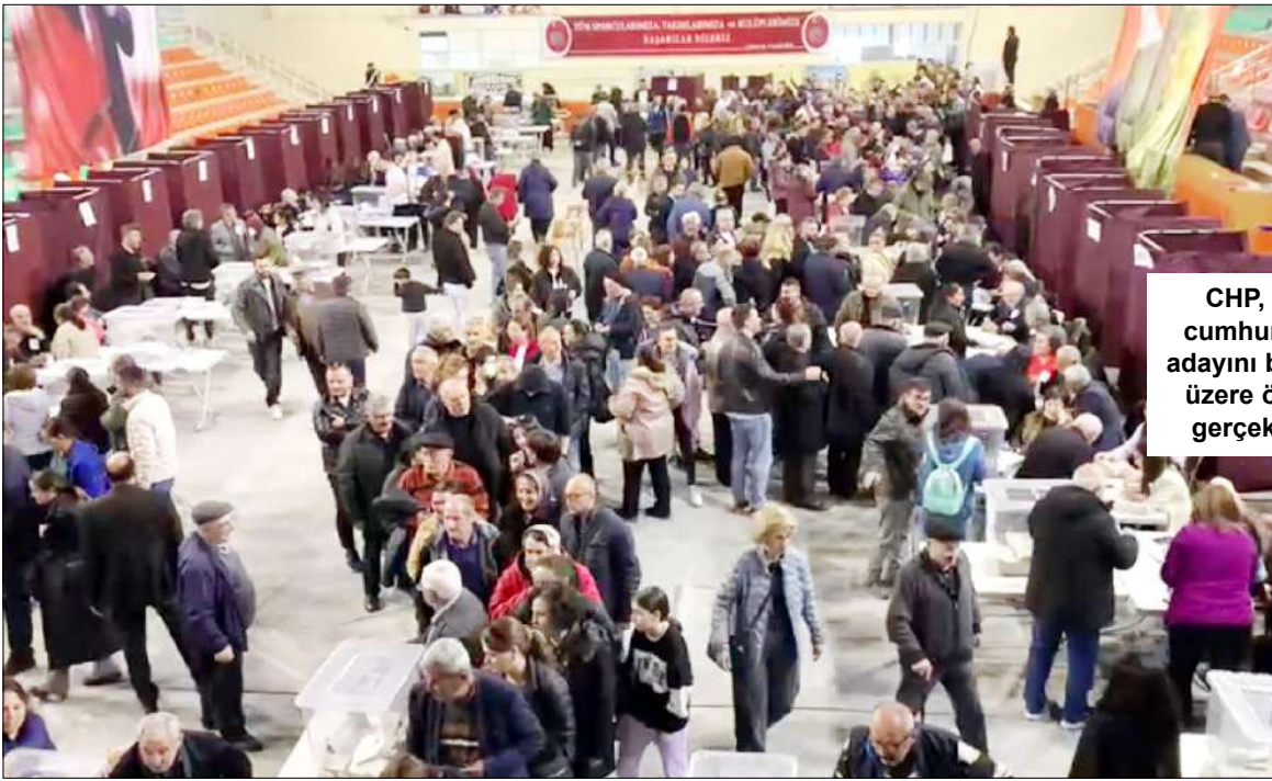
CHP, 81 ilde cumhurbaşkanı adayını belirlemek üzere ön seçim gerçekleştirdi.

Oy kullanma işlemleri gece geç saatlere kadar devam etti. (Çağrı Uzun)