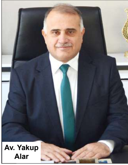
Av. Yakup Alar

lar. Diploma yolsuzluğuna, belediyelerdeki yolsuzluk iddialarına cevabı olmayanlara hak, hukuk, adalet diye gösteri yapanlara soruyorum; Yüzyılın yolsuzluk ve usulsüzlük iddialarını savunduğunuzun