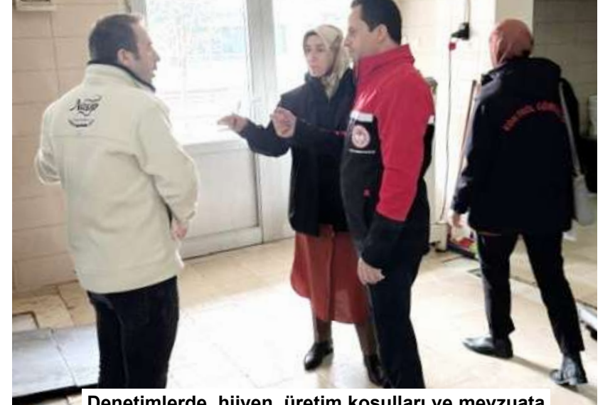
Denetimlerde, hijyen, üretim koşulları ve mevzuata uygunluk titizlikle inceleniyor.

Ekmek fırınları ve unlu mamul üretim yerlerinde yapılan denetimlerde, hijyen koşulları, üretimde kullanılan malzemelerin uygunluğu, personelin hijyen kurallarına uyumu, ürünlerin gramaj ve saklama koşulları gibi unsurlar titizlikle kontrol ediliyor. Denetimlerin, halk sağlığını korumak ve gıda güvenliğini sağlamak amacıyla aralıksız devam edeceği belirtildi. (Haber Merkezi)