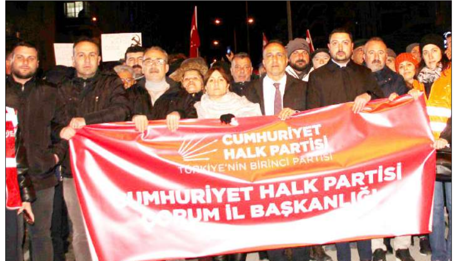
Bahabey Caddesi'nde toplanan kalabalık, Kadeş Barış Meydanı'na kadar "Her şey çok güzel olacak" sloganları eşliğinde yürüdü.