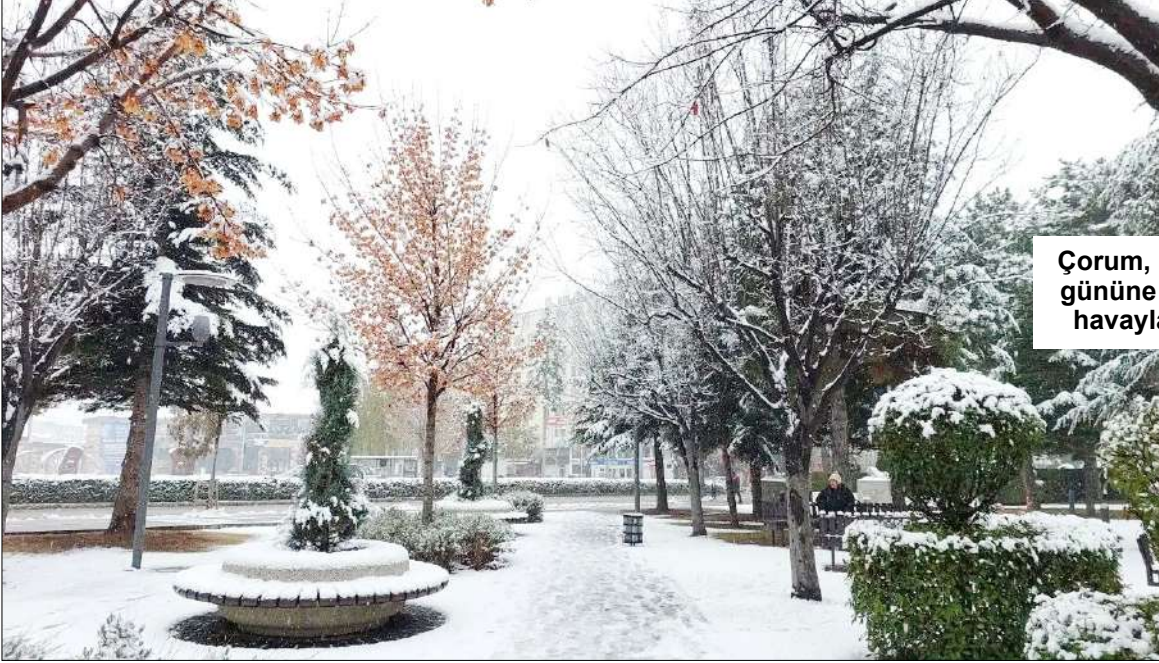
Çorum, Çarşamba gününe soğuk bir havayla uyandı.