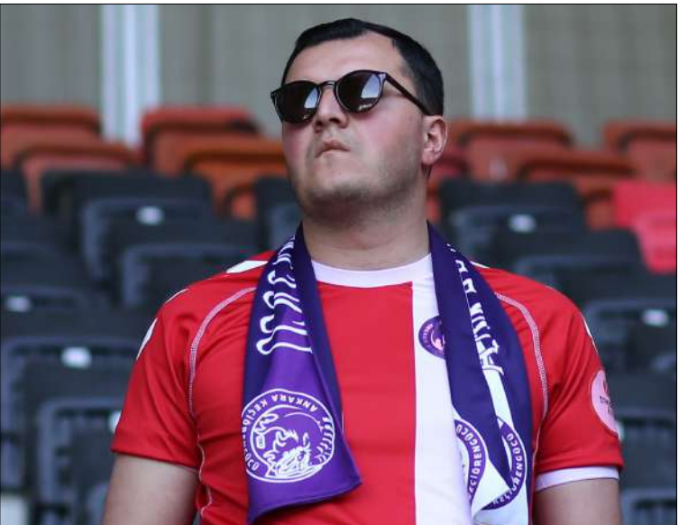
Keçiörengücü'nün Çorumlu taraftarı bu sezon da takımının deplasman tribünündeki tek taraftarıydı

Çorum'da yalnız bırakmadı. Ankara'da yaşayan ve as-