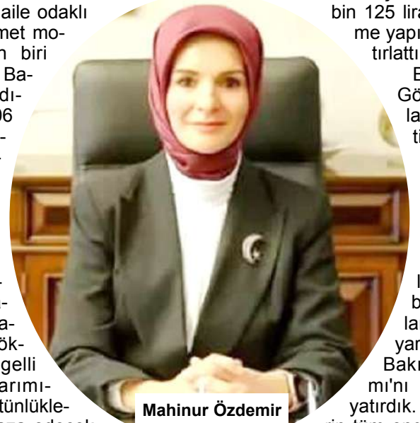
Mahinur Özdemir Göktaş