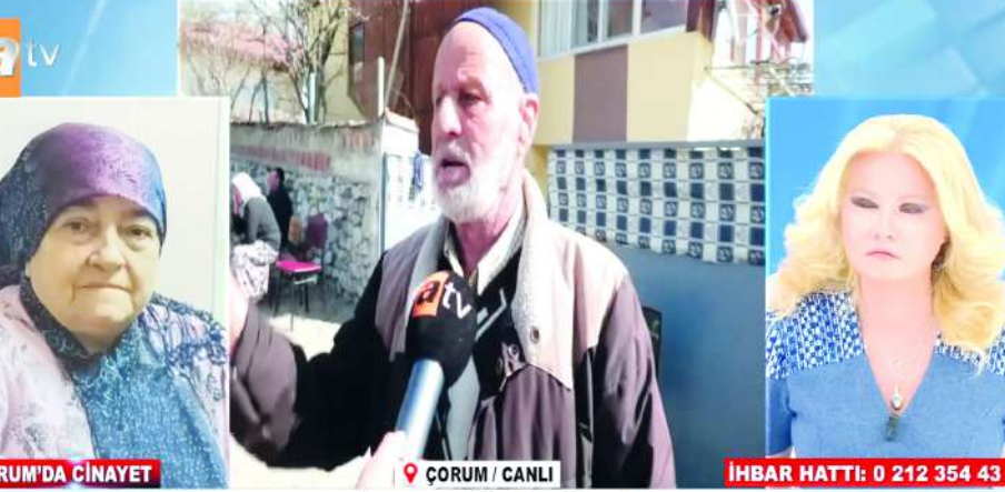
8 BİÇAK DARBESİYLE ÖLDÜRÜP, EVİ YAKTILAR "BENİ ÖLDÜREMEDİKLERİ İÇİN EŞİMİ ÖLDÜRDÜLER"